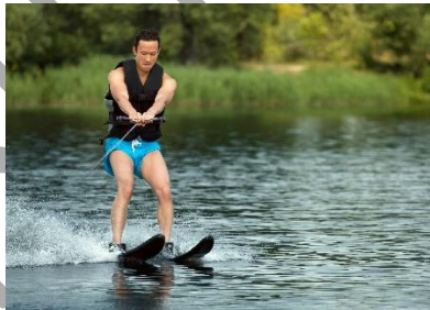
8. On ..... na nartach wodnych.