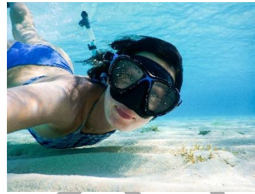
5. Ona .....