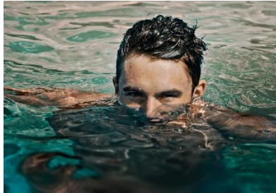
2. On .....