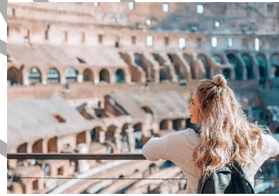
6. Ona ..... miasto.