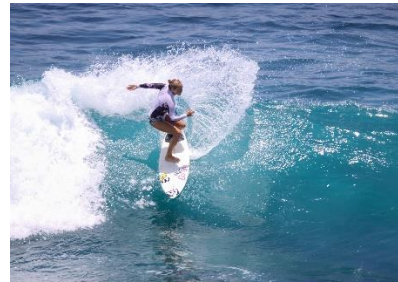
9. Ona .....