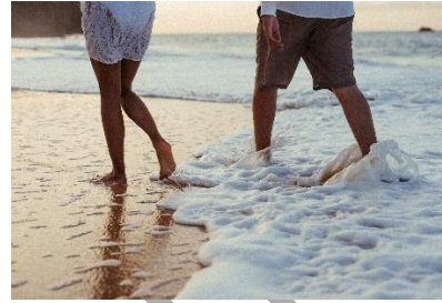
3. Oni ..... po plaży.