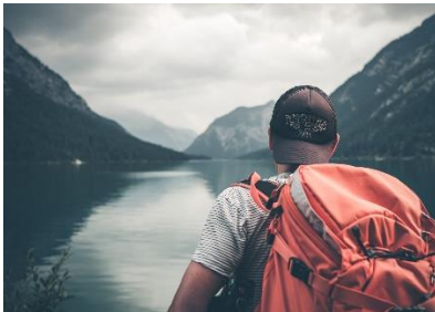
7. On ..... po górach.