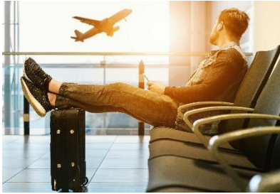
1. On .....

spacerować – surfować – podróżować – nurkować – pływać – chodzić – jeździć – opalać się zwiedzać